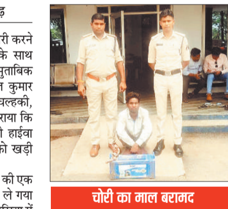
चोरी का माल बरामद

संदेही से बैटरी चोरी के संबंध में पूछताछ करने पर बैटरी चोरी करना स्वीकार किया। आरोपी के मेमोरेंडम पर चोरी गई बैटरी कीमती करीब 11,000 रुपये का जब्त किया